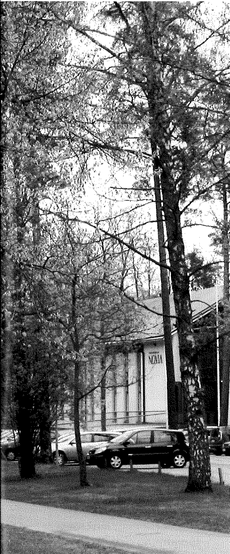
I Raseborg erbjuder Novia utbildning inom naturbruk, teknik och informationsbehandling. Landets enda svenskspråkiga naturbruksutbildning är koncentrerad till denna enhet och i en naturskön miljö.